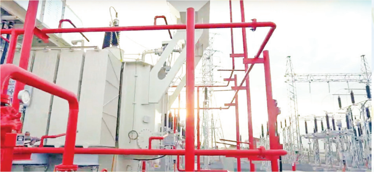
Tuân thủ quy định pháp luật về an toàn điện thuộc trách nhiệm của khách hàng sử dụng điện theo quy định của pháp luật.

ban nhân dân các huyện, thị xã, thành phố trên địa bàn tỉnh và Công ty Điện Lực Gia Lai tăng cường kiểm tra, hướng dẫn sử dụng điện an toàn trên toàn tỉnh.