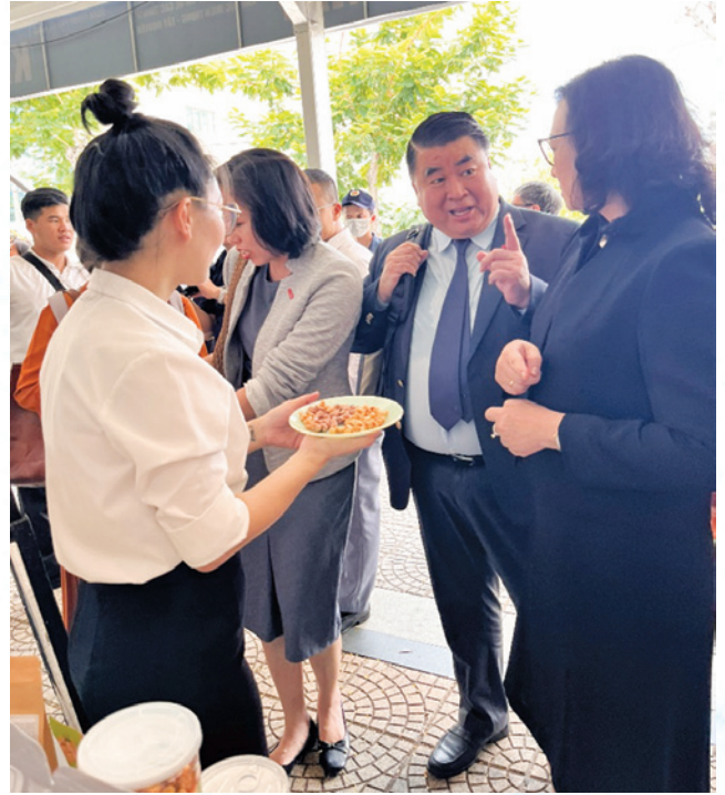
Lãnh đạo Bộ Công Thương và du khách đến tham quan mua sắm tại gian hàng.

thương mại đã tổ chức cho các Doanh nghiệp, Hợp tác xã và các chủ thể có sản phẩm OCOP trưng bày sản phẩm đặc trưng của tỉnh tại Khuôn viên bờ Đông Cầu rồng thành phố Đà Nẵng nhằm giao lưu giới thiệu quảng bá sản phẩm đặc trưng của tỉnh Gia Lai đến với 15 tỉnh trong khu vực miền Trung Tây Nguyên. Tại khu vực trưng bày tỉnh Gia Lai có hơn 20 sản phẩm công nghiệp nông thôn tiêu biểu, sản phẩm OCOP, sản phẩm đặc trưng của tỉnh được giới thiệu, quảng bá. Các sản phẩm tham gia trưng bày gồm: Bò khô, Bò một nắng muối kiến vàng, Mật ong và các sản phẩm từ mật ong, các sản phẩm chế biến từ yến, Hạt điều, Hạt mắc Ca, Cà phê, các