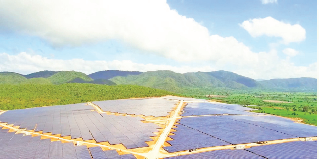
Nhà máy điện mặt trời.

Sản lát 54.650 tấn/7,76 triệu USD; hạt điều 39.500 tấn/ 45,5 triệu, cao su tự nhiên 1.227 tấn/1,25 triệu USD và một số mặt hàng khác 49,9 triệu USD (vật tư, phân bón, đường, chuối, xoài, dứa, ngô hạt, đậu tương)