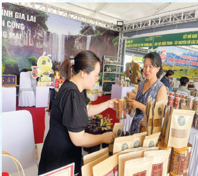
Các doanh nghiệp giới thiệu sản phẩm tại Khu vực trung bày.