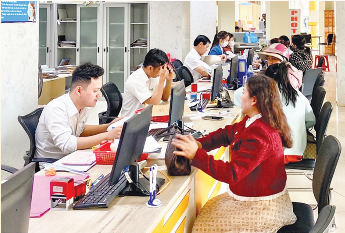
Thực hiện tốt công tác giải quyết thủ tục hành chính lĩnh vực ngành Công Thương cho tổ chức, cá nhân, phần đầu 100% thủ tục hành chính được giải quyết trước hẹn và đúng hẹn, không để xảy ra trường hợp thủ tục hành chính giải quyết trễ hẹn.

đầu trong công tác lãnh đạo, chỉ đạo, kiểm tra việc thực hiện kỷ luật, kỷ cương hành chính. (2) Chú trọng đến công tác phòng ngừa, tạo môi trường làm việc dân chủ, công khai, minh bạch, xây dựng tập thể đơn vị đoàn kết, không ngừng nâng cao ý thức chấp hành kỷ cương, kỷ luật của công chức, viên chức, người lao động. (3) Người đứng đầu các phòng, đơn vị chịu trách nhiệm nêu để xảy ra vi phạm pháp luật, vi phạm kỷ luật, kỷ cương tại cơ quan. (4) Thường xuyên kiểm tra, chấn chỉnh, xử lý nghiêm các trường hợp công chức, viên chức vi phạm về nội quy, giờ giấc làm việc, thái độ giao tiếp ứng xử, đòi