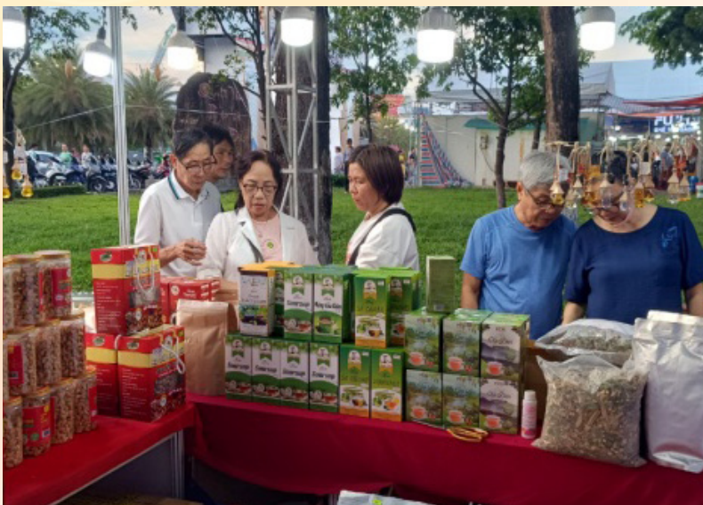
Khách tham quan gian mua sắm tại gian hàng OCOP của tỉnh Gia Lai.