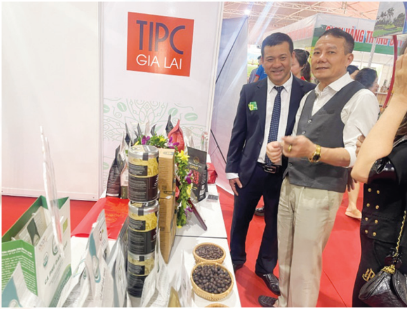
Giới thiệu sản phẩm tại Hội chợ CNNTTB và lễ trao giải Cấp Khu vực.

tham gia bình chọn sản phẩm công nghiệp nông thôn cấp Khu vực.