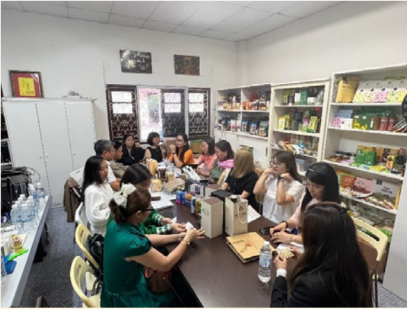
Kết nối B2B với các Doanh nghiệp tại văn phòng Tham tán Thương mại VN tại Singapore