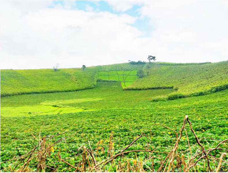
Tăng diện tích cây xanh bình quân trên mỗi người dân đô thị.

và phát triển công nghệ; Tuyên truyền, phổ biến kiến thức và nâng cao nhận thức; Hợp tác song phương và đa phương, huy động nguồn lực; Giám sát, đánh giá. Kế hoạch cũng nêu rõ trách nhiệm giao Bộ Công Thương: