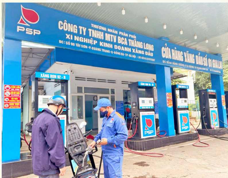
Hoạt động kinh doanh xăng dầu trên địa bàn thành phố Pleiku - Gia Lai.

Điều chỉnh giá bán các mặt hàng xăng dầu: Do thương nhân đầu mỗi kinh doanh xăng dầu, thương nhân phân phối xăng dầu quy định nhưng