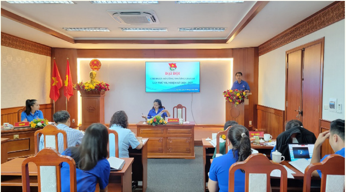
Ban Chấp hành Chi đoàn Sở Công Thương tổ chức Đại hội Chi đoàn nhiệm kỳ 2024 - 2027.

Ban Chấp hành nhiệm kỳ mới đáp ứng yêu cầu, nhiệm vụ, đảm bảo thực hiện có hiệu quả Nghị quyết do đại hội đề ra.