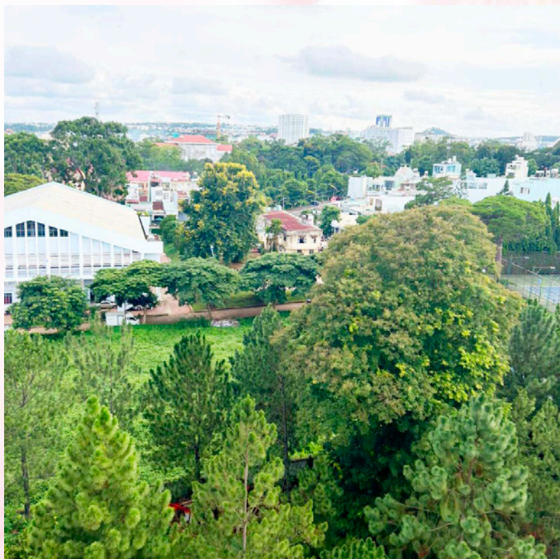
Tăng diện tích cây xanh bình quân trên mỗi người dân đô thị góp phần làm mát bền vững.

Các yêu cầu về giảm hiệu ứng đảo nhiệt đô thị và chống chịu với nắng nóng cực đoan được nghiên cứu, lồng ghép trong các chương trình phát triển đô thị cấp quốc gia, cấp tỉnh, kế hoạch hành động ứng phó với biến đổi khí hậu của quốc gia và từng địa phương, quy hoạch tỉnh và các quy hoạch chuyên ngành có liên quan của tỉnh. Hoạt động làm mát bền vững được triển khai thực hiện tại các đô thị đặc biệt, đô thị loại I và loại II.