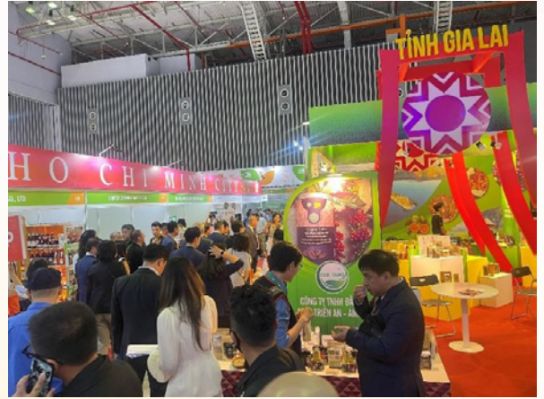
Gian hàng tỉnh Gia Lai tham gia Hội chợ Foodexpo tại Thành Phố Hồ Chí Minh.

là hoạt động nằm trong chương trình cấp Quốc gia về xúc tiến thương mại hàng năm, đây là sự kiện quan trọng giúp các doanh nghiệp trong tỉnh Gia Lai có nhiều cơ hội tiếp cận được với nhiều đối tác của các nước trong khu vực Asean, khai thác tối đa lợi ích khu vực tự do mậu dịch Asean - Trung Quốc đem lại. Trung Quốc là thị trường mơ ước của rất nhiều Doanh nghiệp với nhiều quốc gia, nền kinh tế Trung Quốc đang phát triển mạnh