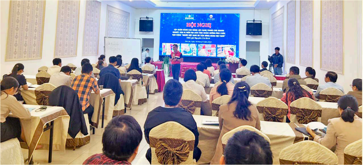
Diễn giả Liên đoàn Thương mại và Công nghiệp Việt Nam, chi nhánh miền Trung - Tây Nguyên.

mở rộng kênh phân phối hàng Việt Nam thuận tiện, linh hoạt cho doanh nghiệp, hợp tác xã, cơ sở sản xuất kinh doanh, các tiểu thương trên địa bàn tỉnh; Nâng cao nhận thức và hành vi