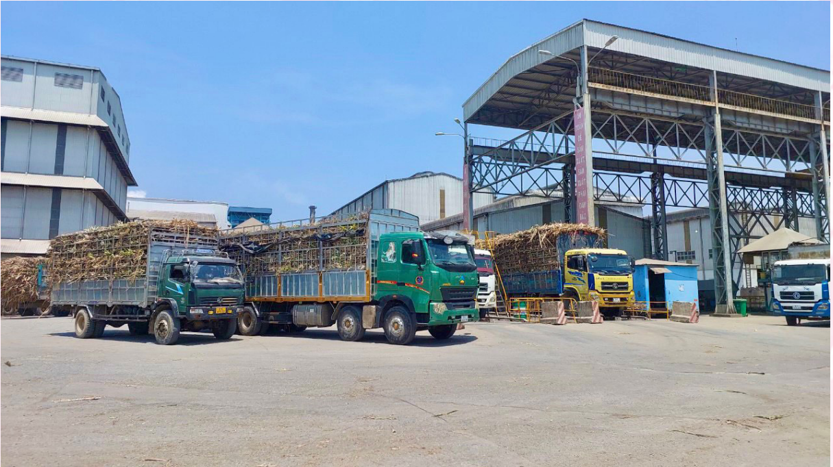
Hoạt động nhà máy đường.