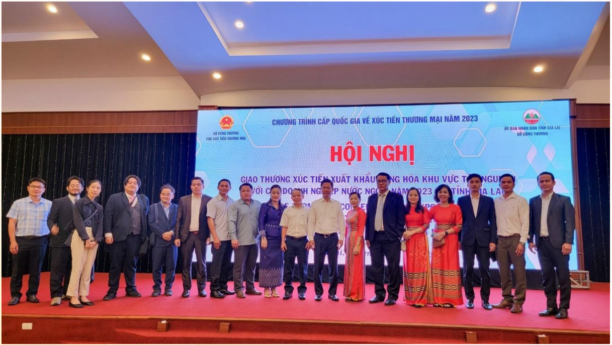
Hội nghị giao thương Xúc tiến Xuất Khẩu hàng hóa Khu vực Tây Nguyên với các Doanh nghiệp nước ngoài năm 2023.

trung cao vào các hoạt động Xúc tiến thương mại ngoại thương nhằm hỗ trợ tối đa cho các doanh nghiệp, tận dụng tốt nhất cơ hội để đẩy mạnh xuất khẩu và tiêu thụ hàng hóa. Theo đó, hoạt động Xúc tiến thương mại những năm gần đây đã được triển khai với định hướng chính là đẩy mạnh xuất khẩu đặc biệt chú trọng khai thác các thị trường Châu Á, kết hợp với các chương trình Xúc tiến thương mại Quốc Gia, đẩy mạnh sự hợp tác với các nước trong khu vực tam giác phát triển và phối hợp chặt chẽ mỗi liên kết vùng Tây nguyên nhằm mang tính bền vững, cân bằng đảm bảo thị trường ổn định, lâu dài cho hoạt động xuất khẩu tỉnh nhà.