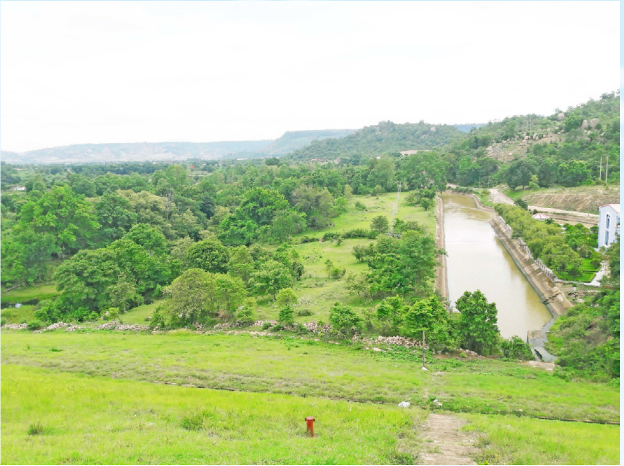
Thủy lợi Ayun Hạ.

các hành vi bị cấm theo quy định của Luật Phòng, chống thiên tai; thực hiện nghiêm Nghị định số 03/2022/NĐ-CP ngày 06/01/2022 của Chính phủ Quy định xử phạt vi phạm hành chính trong lĩnh vực phòng, chống thiên tai; khai thác và bảo vệ công trình thủy lợi; đê điều. Triển khai thực hiện nghiêm Quyết định số 27/2023/QĐ-UBND ngày 24/6/2023 của Ủy ban nhân dân tỉnh về ban hành quy định bảo đảm yêu cầu phòng, chống thiên tai đối với việc quản lý, vận hành, sử dụng công trình trên địa bàn tỉnh Gia Lai.