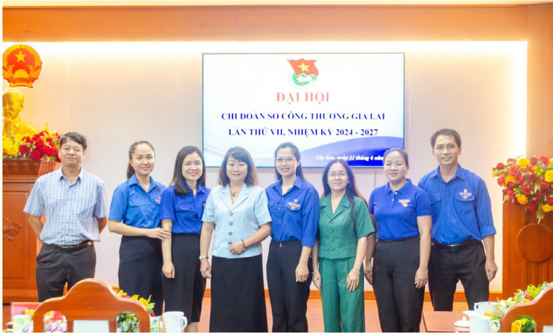
Tham dự Đại hội có các đại biểu là Phó Bí thư Đảng ủy Sở, đại diện Ban chấp hành Công đoàn, Bí thư Đoàn khối các cơ quan và doanh nghiệp tỉnh cùng toàn thể đoàn viên thanh niên chi đoàn Sở Công Thương.

động cách mạng phát huy vai trò xung kích, tình nguyện, sáng tạo của thanh niên trong xây dựng và bảo vệ Tổ quốc. Tổ chức các chương trình đồng hành, hỗ trợ thanh niên. Tăng cường công tác chăm lo, bồi dưỡng thiếu niên nhi đồng; đặc biệt là con cán bộ, công nhân viên và người lao động trong cơ quan. Nâng cao chất lượng hoạt động tổ chức đoàn vững mạnh về chính trị, tư tưởng, tổ chức và hành động; mở rộng mặt trận đoàn kết tập hợp thanh