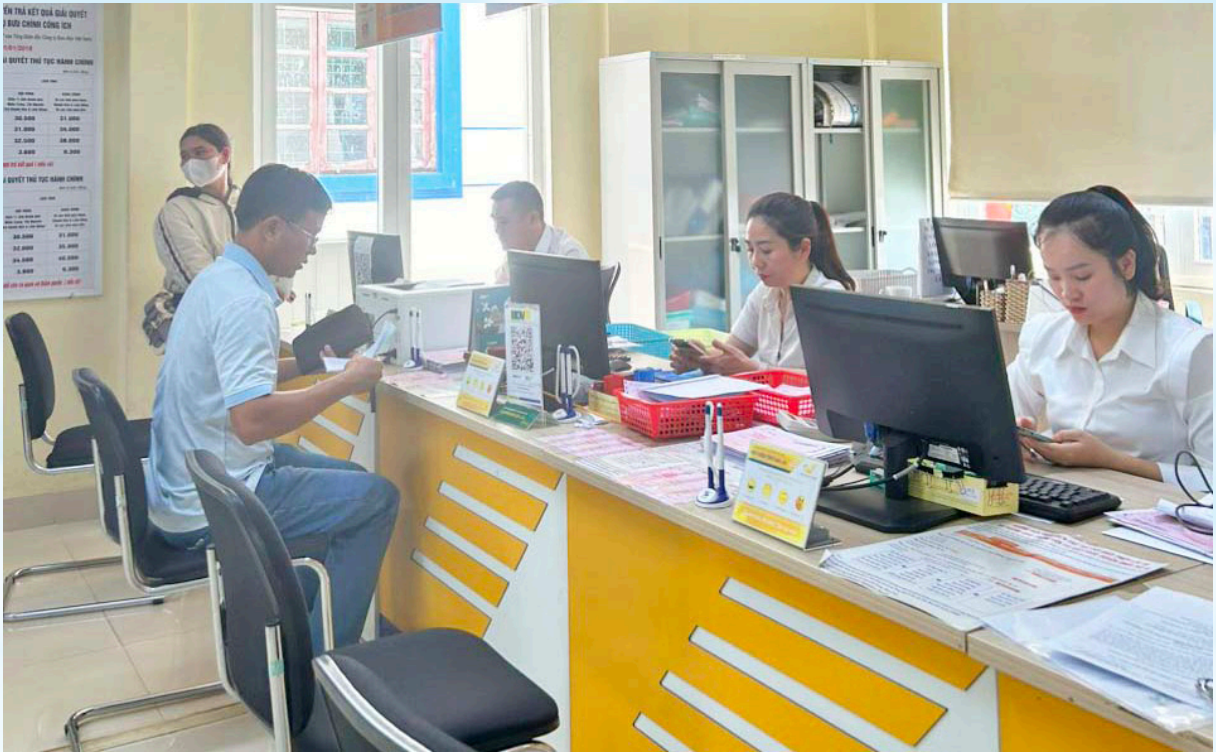
Trung tâm Phục vụ hành chính công tỉnh.

đều được trả trước hẹn, đúng hẹn, không có hồ sơ thủ tục hành chính giải quyết trễ hạn, 6 tháng đầu năm cơ bản đã hoàn thành các nhiệm vụ theo kế hoạch cải cách hành chính năm 2024 của Sở đã đề ra.