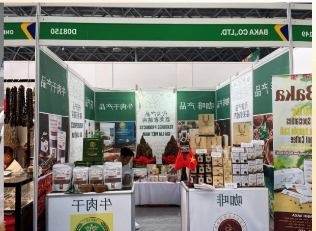
Doanh nghiệp đang tư vấn bán hàng giới thiệu sản phẩm tại Hội chợ (CAEXPO 2023) Quảng Tây, Trung Quốc.