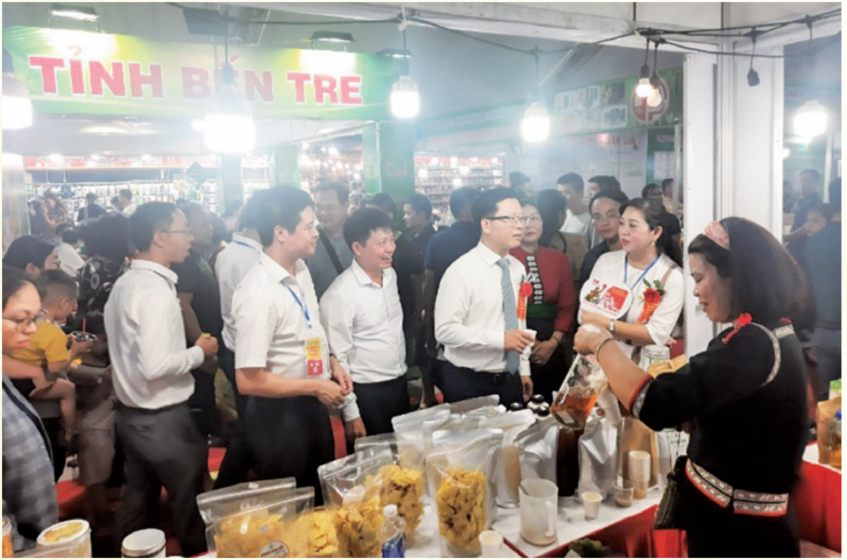
Lãnh đạo tỉnh tham quan gian hàng.

Biên lần này là các chủ thể có sản phẩm OCOP đạt từ 3 sao trở lên như bò khô, mật ong, cà phê, tiêu, hạt mắc ca, hạt điều, trà thảo mộc và một số