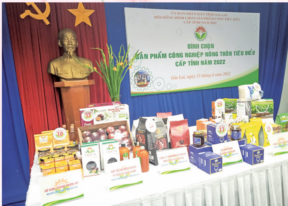
Bình chọn sản phẩm CNNT tiêu biểu cấp tỉnh năm 2022.

Đối tượng bình chọn là các tổ chức, cá nhân trực tiếp đầu tư, sản xuất công nghiệp - tiểu thủ công nghiệp tại các huyện, thị xã, thị trấn, xã và các phường thuộc thành phố