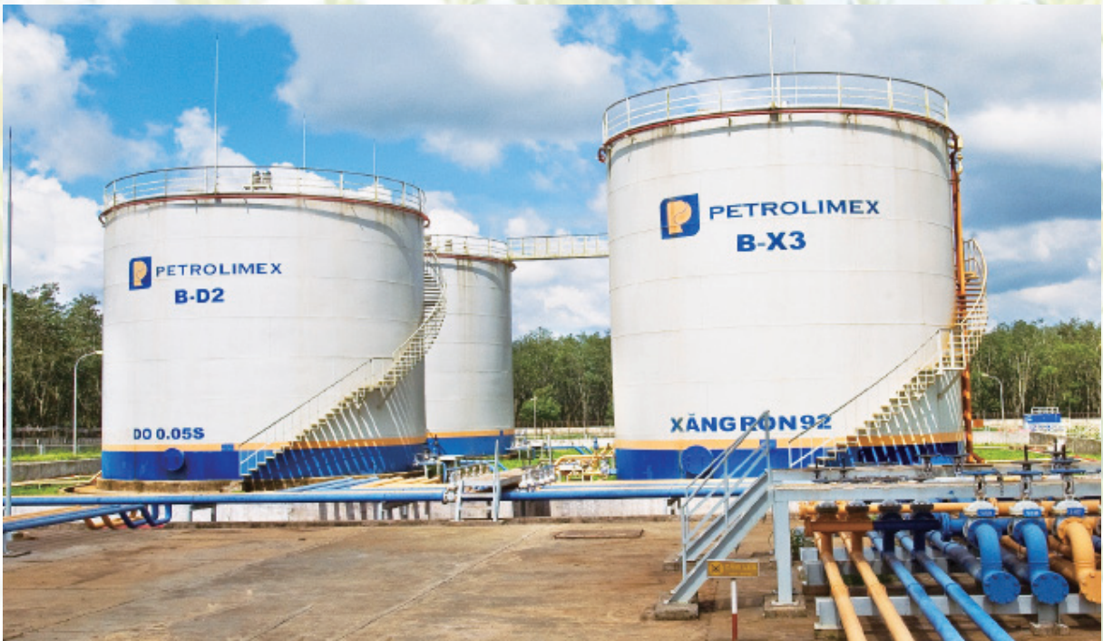
Hoạt động kinh doanh xăng dầu trên địa bàn tỉnh. Ảnh TC