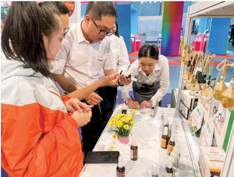
Khách tham quan mua sắm tại gian hàng.

và Thành phố Hồ Chí Minh. Về phía bạn Lào có Lãnh đạo các tỉnh Savannakhet, thủ đô Vientiane, tỉnh Houaphanh, tỉnh Champasak, tỉnh Attapeu, tỉnh Bolikhamxai, tỉnh Khammouane, tỉnh Salavan. Đại diện cơ quan ngoại giao có đại diện Tổng lãnh sự quán