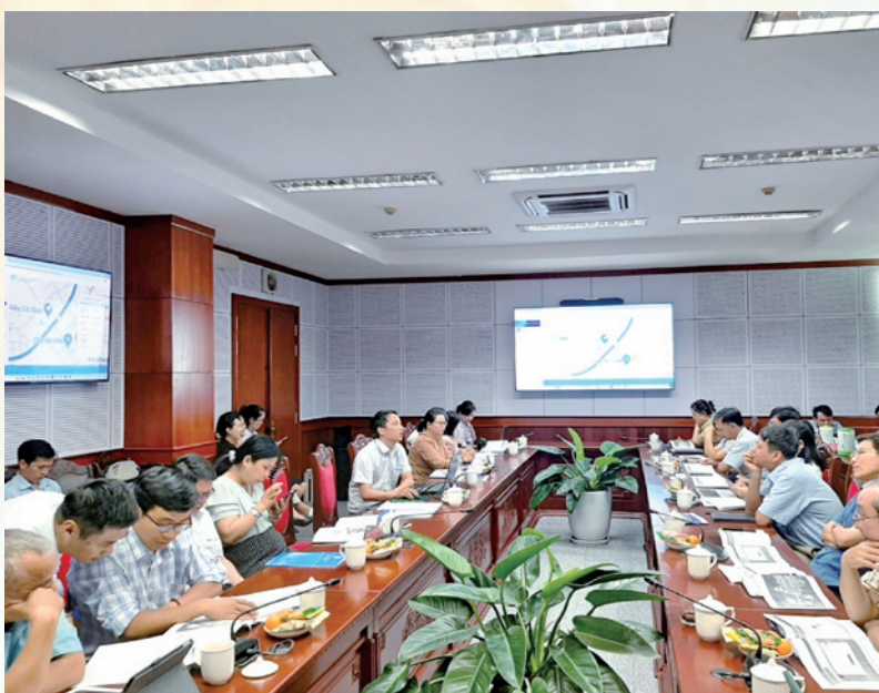
Quang cảnh hội nghị.

Tại hội nghị, đại diện VNPT Gia Lai đã giới thiệu về Hệ thống quản lý và khai thác dữ liệu số ngành Công Thương; hướng dẫn sử dụng tổng thể cho người dùng; cách thức cập nhật, bổ sung các lớp dữ liệu; cách khai thác các dữ liệu, lưu trữ, xử lý nghiệp vụ và báo cáo