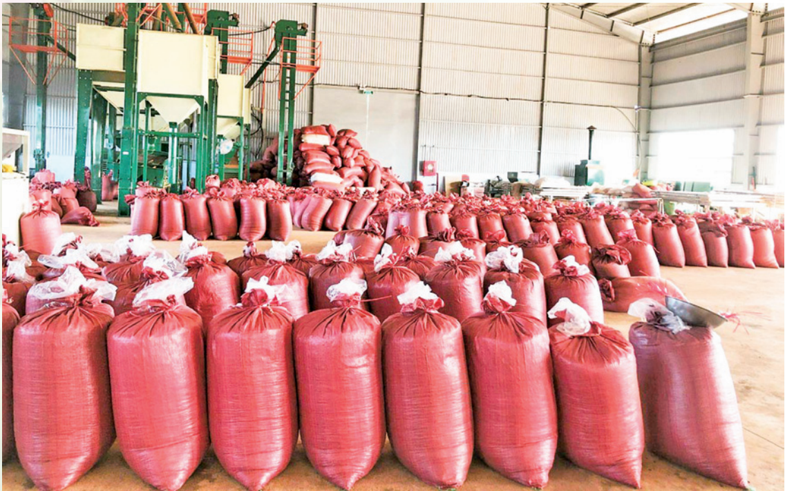
Hoạt động nhà máy chế biến nông sản.