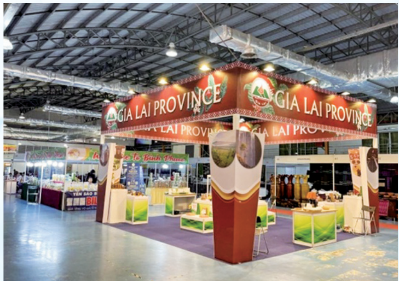
Gian hàng tỉnh Gia Lai tại Hội chợ.

Đến tham dự khai mạc về phía Việt nam có Lãnh đạo các tỉnh: Quảng Bình, Quảng Trị, Thừa Thiên Huế, Gia Lai, Bình Phước, Đồng Nai