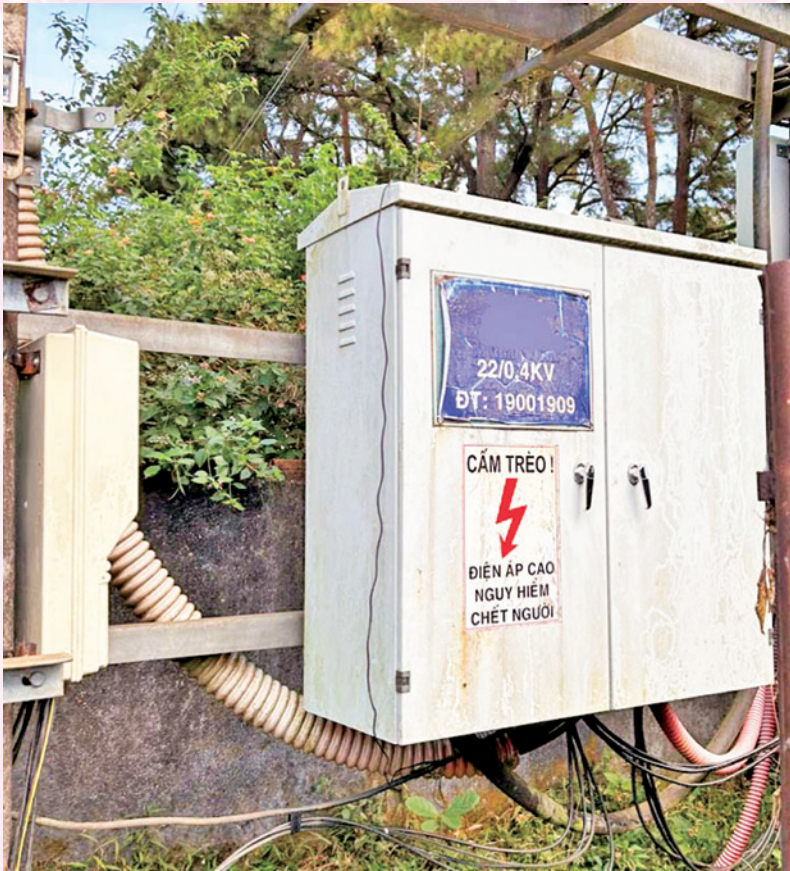
An toàn cung ứng và sử dụng điện. Ảnh HT

quy định trong việc an toàn cung ứng và sử dụng điện. Bảo đảm cung cấp điện theo Kế hoạch cung cấp điện và vận hành hệ thống điện năm 2024