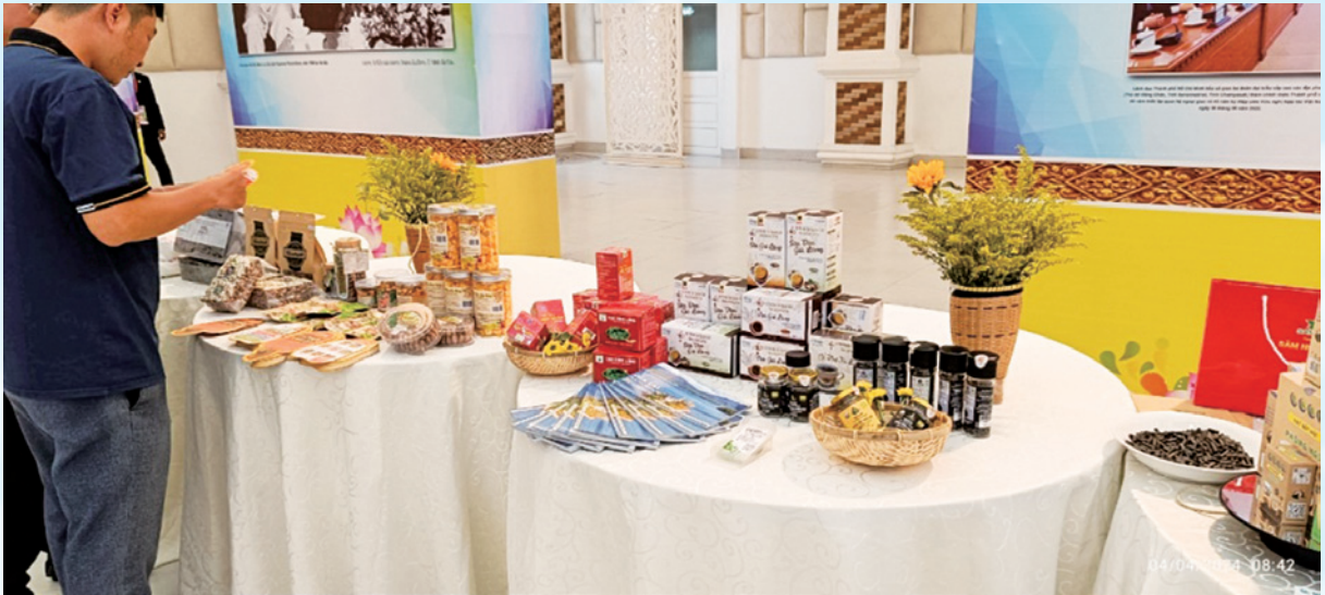
Trung bày giới thiệu sản phẩm tại Hội nghị Xúc tiến thương mại - Đầu tư các tỉnh thành nước CHXHCN Việt Nam và các tỉnh, thành nước CHDCND Lào.

CHDCND Lào vào sáng ngày 04/4/2024 do UBND Thành phố Hồ Chí Minh phối hợp Tổng Lãnh sự quán Việt Nam tại tỉnh Savannakhet, các sở ngành của tỉnh Savannakhet tổ chức, với quy mô gần 150 đại biểu tham dự, trong đó có gần