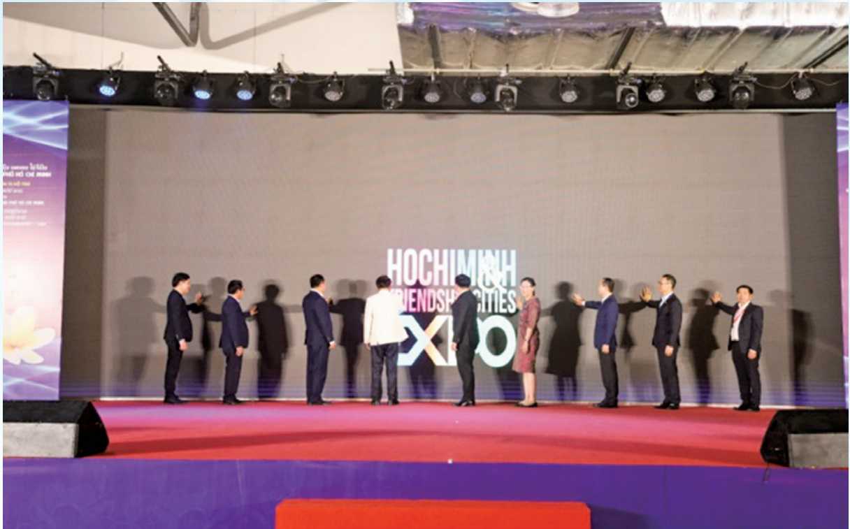
Khai mạc “Triển lãm Thành phố Hồ Chí Minh và các tỉnh, thành hữu nghị tại Savannakhet lần thứ 4”.