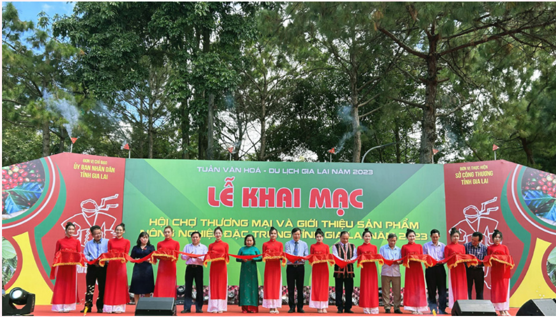
Lễ khai mạc Hội chợ thương mại và giới thiệu sản phẩm nông nghiệp đặc trưng tỉnh Gia Lai năm 2023.