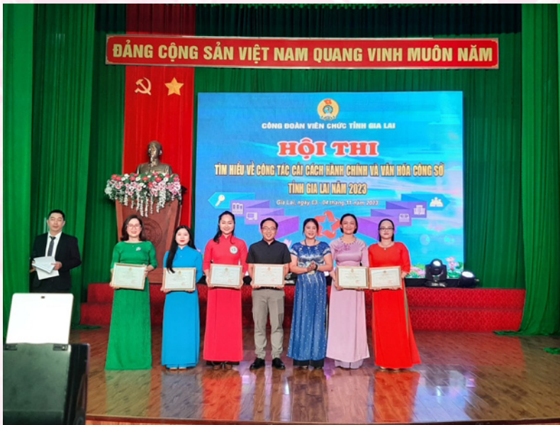
Sở Công Thương vinh dự đạt giải nhì phần thi Thuyết trình, và giải khuyến khích toàn đoàn Hội thi tìm hiểu về cải cách hành chính và văn hóa công sở năm 2023.