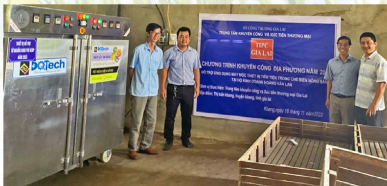
Chương trình Khuyến công địa phương năm 2023; “Hỗ trợ ứng dụng máy móc thiết bị tiên tiến trong chế biến nông sản” tại thị xã An Khê và huyện Kbang.