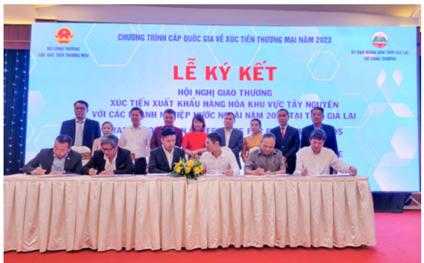
Lễ ký kết biên bản ghi nhớ hợp tác kinh doanh giữa doanh nghiệp khu vực Tây Nguyên và các tỉnh, thành phố của Việt Nam với doanh nghiệp xuất nhập khẩu.