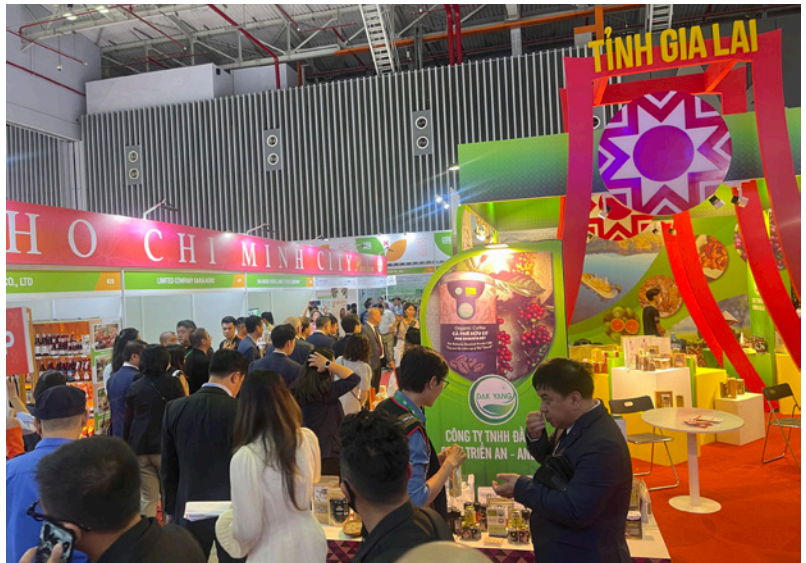
Khu trưng bày của tỉnh Gia Lai tại Hội chợ Triển lãm Quốc tế Công nghiệp thực phẩm Việt Nam 2023.

Hội chợ là sự kiện xúc tiến thương mại quan trọng có quy mô lớn nhất trong lĩnh vực công nghiệp thực phẩm và hàng nông sản do Cục Xúc tiến thương mại trực tiếp tổ chức hàng năm và đây cũng là chương trình trong khuôn khổ cấp quốc gia về Xúc tiến thương mại nhằm phát triển xuất khẩu trong lĩnh vực công nghiệp thực phẩm và hàng