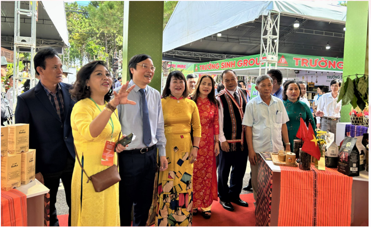
Lãnh đạo tỉnh Gia Lai tham quan tại Hội chợ.