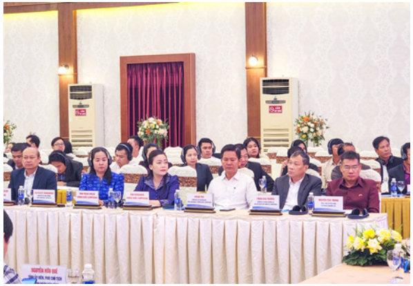
Đại biểu các nước: Vương quốc Campuchia, CHDCND Lào, Nhật Bản và Việt Nam tham dự tại Hội nghị.