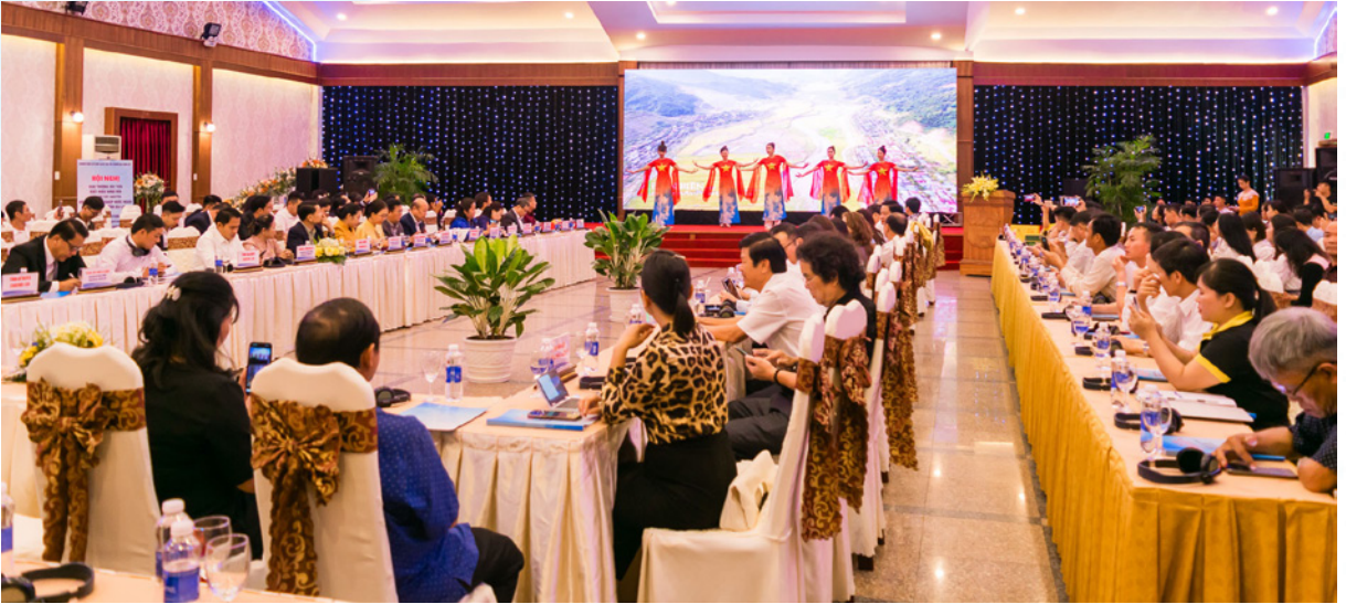
Hội nghị giao thương xúc tiến xuất khẩu hàng hóa khu vực Tây Nguyên với doanh nghiệp nước ngoài năm 2023.

ngành và doanh nghiệp tỉnh Rattanakiri, Preah Vihear (Vương quốc Campuchia); đại diện các doanh nghiệp đến từ Nhật Bản.