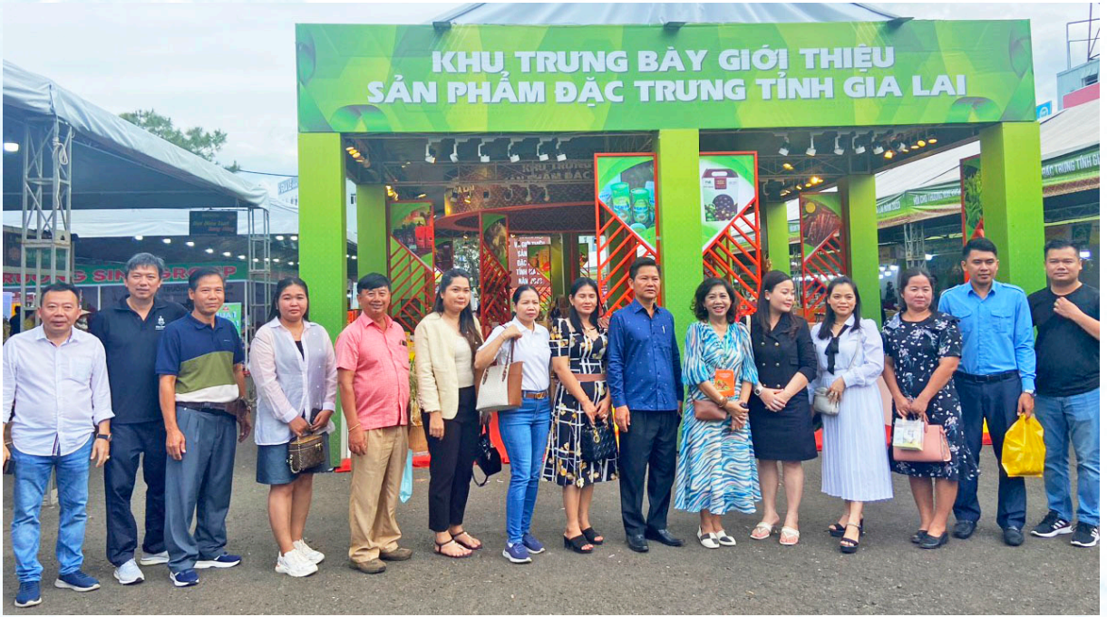
Đoàn đại biểu Vương quốc Campuchia, CHDCND Lào tham quan, kết nối tại Hội chợ thương mại và giới thiệu sản phẩm nông nghiệp đặc trưng tỉnh Gia Lai năm 2023.

hạn chế, đề ra các giải pháp hữu hiệu nhằm tận dụng tiềm năng, cơ hội, cũng như tận dụng những ưu đãi của các Hiệp định thương mại tự do song phương và đa phương thế hệ mới để đẩy mạnh kết nối tiêu thụ sản phẩm hàng hóa xuất khẩu vào thị trường Campuchia, Lào và các nước ASEAN trong bối cảnh hiện nay.