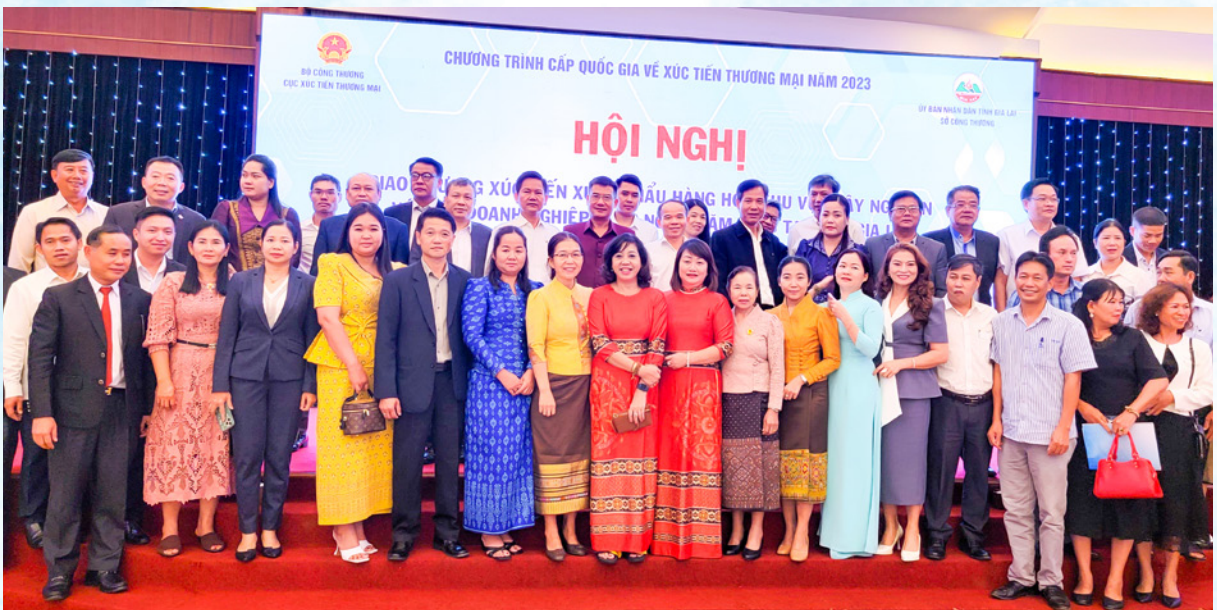
Đại biểu các nước: Vương quốc Campuchia, CHDCND Lào, Nhật Bản và Việt Nam tham dự Hội nghị.