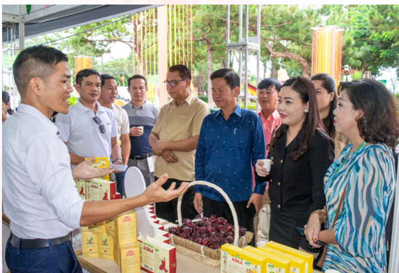
Đoàn đại biểu Vương quốc Campuchia, CHDCND Lào tham quan, kết nối tại Hội chợ thương mại và giới thiệu sản phẩm nông nghiệp đặc trưng tỉnh Gia Lai năm 2023.