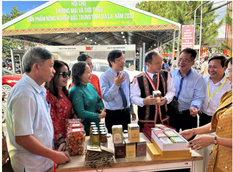
Lãnh đạo tỉnh Gia Lai tham quan tại Hội chợ thương mại và giới thiệu sản phẩm nông nghiệp đặc trưng tỉnh Gia Lai năm 2023.

Công nghiệp chế biến, chế tạo: ước thực hiện tháng 11 đạt 2.131,1 tỷ đồng, 11 tháng năm 2023 ước đạt 17.560,1 tỷ đồng,