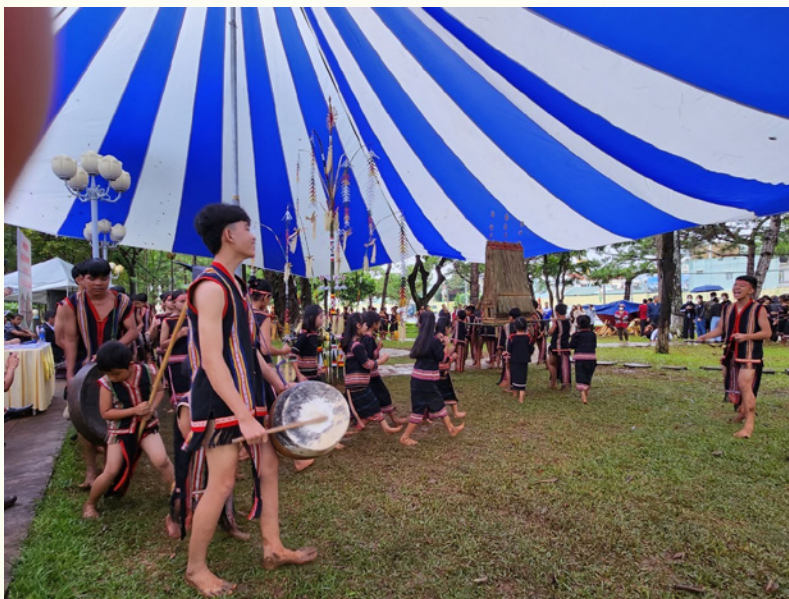
Trình diễn Cồng Chiêng, phục dựng lễ hội truyền thống của người đồng bào dân tộc thiểu số.

* Hội chợ thương mại và giới thiệu sản phẩm nông nghiệp đặc trưng tỉnh Gia Lai, 05 ngày (từ ngày 11/11 đến ngày 15/11/2023), tại Quảng trường Đại Đoàn Kết khu vực đường Anh hùng Núp (bãi giữ xe và vỉa hè phía Quảng trường). Với quy mô: 200 - 250 gian hàng tiêu chuẩn. Trưng bày, triển lãm, giới thiệu các mặt hàng thủ công,