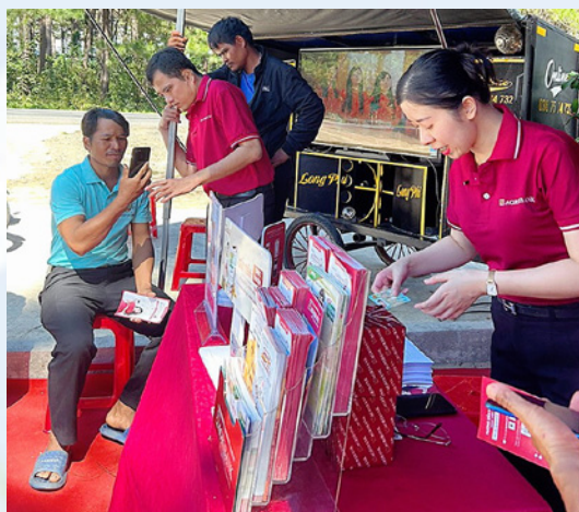
Hội thảo giao lưu kết nối ứng dụng công nghệ số trong tiêu thụ sản phẩm của đồng bào dân tộc thiểu số và miền núi năm 2023 tại xã Đak Ta Ley, huyện Mang Yang, tỉnh Gia Lai.

Nhằm hỗ trợ doanh nghiệp, Hợp tác xã đang hoạt động trên địa bàn các xã đặc biệt khó khăn (ĐBK) thuộc vùng đồng bào dân tộc thiểu số và miền núi (DTTS&MN) có kế hoạch mở rộng kinh doanh, sản xuất. Hộ gia đình, cá nhân người dân tộc thiểu số, hộ nghèo dân tộc Kinh sinh sống tại các xã, thôn vùng đồng bào DTTS&MN ứng dụng chuyển đổi số thông qua sàn thương mại điện tử, ứng dụng đa kênh mở rộng thị trường trên không gian mạng; hướng tới xây dựng hệ thống cơ sở dữ liệu phục vụ xúc tiến thương mại nhằm kết nối hiệu quả với Hệ sinh thái xúc tiến thương mại số. Tăng cường thông tin tuyên truyền, giao lưu, chia sẻ kết nối thúc đẩy tiêu thụ sản phẩm nông sản vùng đồng bào dân tộc thiểu số và sản phẩm đặc trưng của địa phương; Đáp ứng nhu cầu