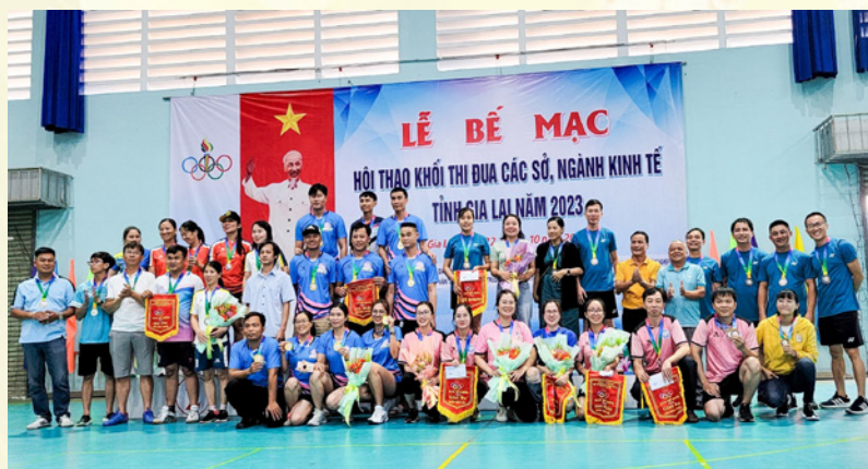
Khối thi đua các Sở, ngành Kinh tế tỉnh Gia Lai dự lễ khai mạc, lễ bế mạc Hội thao năm 2023.