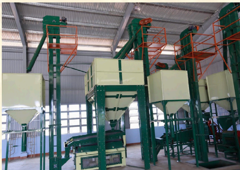
Ảnh minh họa: Hoạt động nhà máy xuất khẩu nông sản. HT

và doanh thu dịch vụ tháng 10 ước đạt 9.954 tỷ đồng; lũy kế 10 tháng đạt 77.192 tỷ đồng, đạt 71,47% kế hoạch và tăng 13,7% so với cùng kỳ. Trong đó: Thương nghiệp ước đạt 66.077 tỷ đồng, chiếm tỷ trọng 85,60%; dịch vụ lưu trú ước đạt 82 tỷ đồng chiếm tỷ trọng 0,11%; dịch vụ ăn uống ước đạt 5.630 tỷ đồng chiếm tỷ trọng 7,29%; dịch vụ lữ hành và hoạt động hỗ trợ du lịch đạt 45 tỷ đồng chiếm tỷ trọng 0,06%; hoạt động dịch vụ khác đạt 5.359 tỷ đồng chiếm tỷ trọng 6,94%.