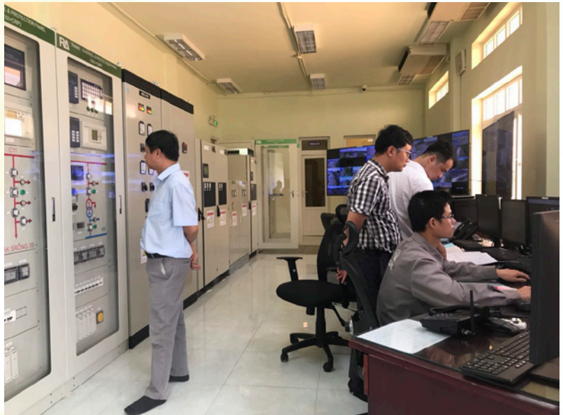
Hoạt động thanh tra Sở Công Thương

Về công tác thanh tra: Thực hiện 04 cuộc thanh tra việc chấp hành pháp luật trong các lĩnh vực hoạt động của ngành tại 16 đơn vị. Qua thanh tra, phát hiện 03 đơn vị có hành vi vi phạm phải xử lý vi phạm hành chính, Chánh Thanh tra đã ra quyết định xử phạt vi phạm hành chính với tổng số tiền là 45 triệu đồng.