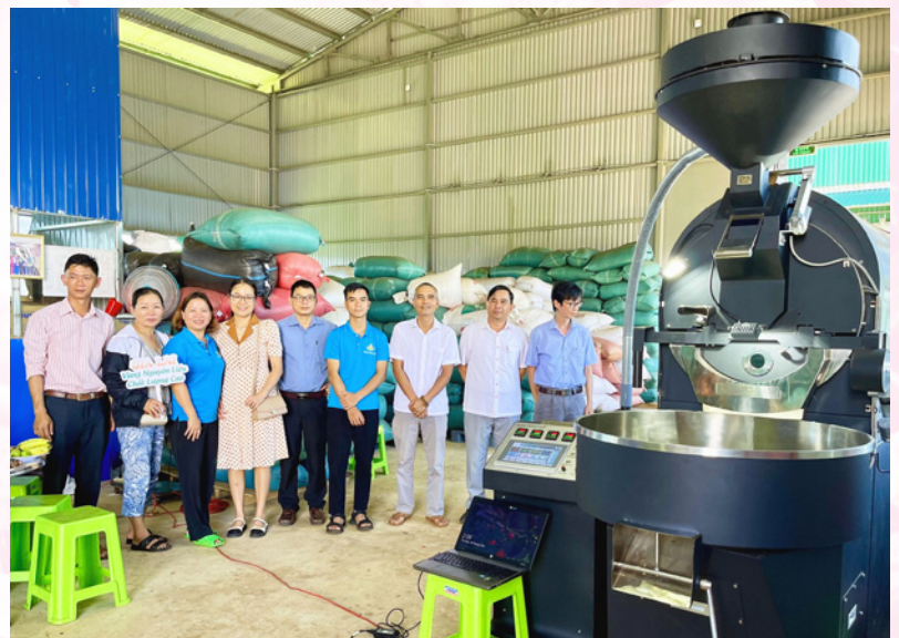
“Hỗ trợ ứng dụng máy móc thiết bị tiên tiến trong chế biến cà phê” tại xã Nam Yang, huyện Đak Đoa.

Đề án có tổng kinh phí 656 triệu đồng, trong đó nguồn Khuyến công địa phương hỗ trợ 300 triệu đồng, còn lại là đối ứng của đơn vị thụ hưởng. Máy rang cà phê, có bộ điều chỉnh nhiệt độ, lưu lượng gió cho ra sản phẩm rang đều màu hơn,