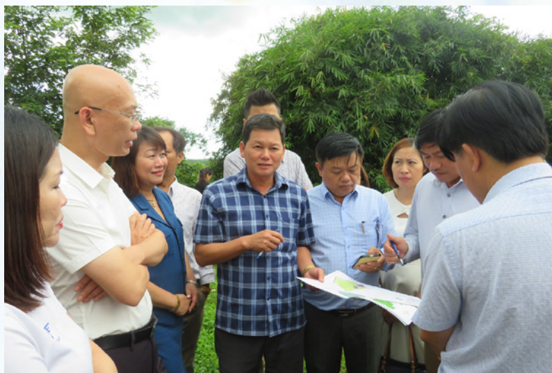
Sở Công Thương tỉnh Gia Lai dẫn Đoàn các doanh nghiệp logistics đi khảo sát thực tế tại cửa khẩu Lê Thanh và địa điểm quy hoạch trung tâm logistics tại huyện Mang Yang.

Tại Hội nghị, các đại biểu cùng nhau chia sẻ về tình hình phát triển hoạt động sản xuất, tiêu thụ nông sản và logistics trên địa bàn tỉnh Gia Lai; các giải pháp đầu tư phát triển logistics