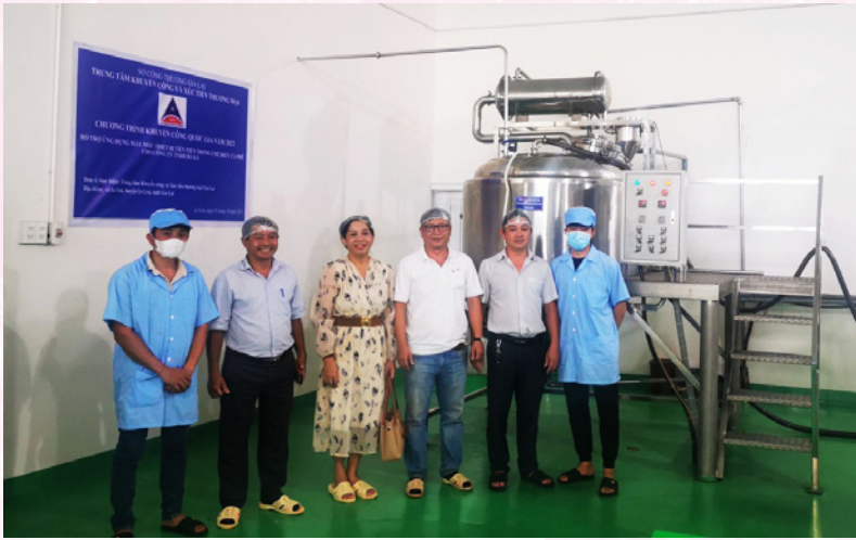
“Hỗ trợ ứng dụng máy móc thiết bị tiên tiến trong chế biến cà phê” cho Công ty TNHH Ba Ka, tại xã Ia Yok, huyện Ia Grai.