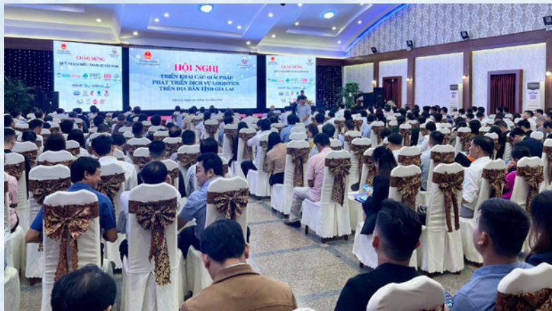
Hội nghị triển khai các giải pháp phát triển dịch vụ logistics trên địa bàn tỉnh Gia Lai.