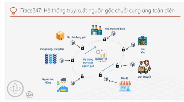
Nền tảng có tích hợp hệ thống truy xuất nguồn gốc iTrace 247 sản phẩm hỗ trợ các doanh nghiệp minh bạch thông tin và xây dựng hình ảnh sản phẩm và doanh nghiệp....

thông tin phục vụ công tác Xúc tiến thương mại và quản lý các đối tác và doanh nghiệp. Lớp tập huấn nhằm nâng cao năng lực cán bộ, chuyên viên hỗ trợ xúc tiến thương mại về quản trị và xử lý dữ liệu, thúc đẩy quá trình chuyển đổi số trong công tác Xúc tiến thương mại.