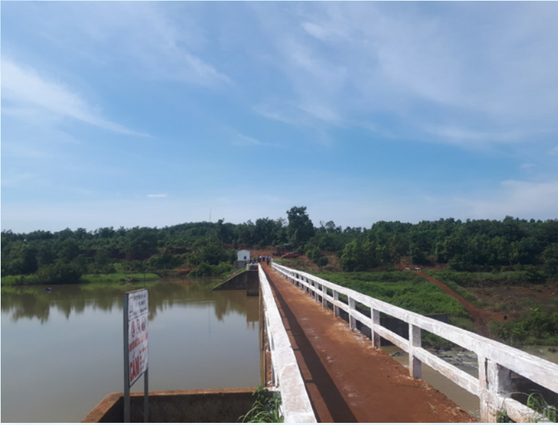
Công tác an toàn trong phòng, chống thiên tai trước, trong mùa mưa, bão năm 2023

Thực hiện đầy đủ các quy định của Luật Phòng, chống thiên tai số 33/2013/QH13 ngày 19/6/2013 của Quốc hội; Nghị định số 66/2021/NĐ-CP ngày 06/7/2021 của Chính phủ về việc quy định chi tiết thi hành một số điều của Luật Phòng, Chống thiên tai và Luật sửa đổi, bổ sung một số điều của Luật Phòng, Chống thiên tai và Luật Đê điều; Quyết định số 18/2021/QĐ-TTg ngày 22/4/2021 của Thủ tướng Chính phủ quy định chi tiết về dự báo, cảnh báo, truyền tin thiên tai và cấp độ rủi ro thiên tai và các văn bản hiện hành khác có liên quan.